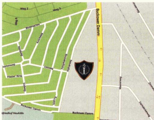
Buckower Damm 114, 12349 Berlin